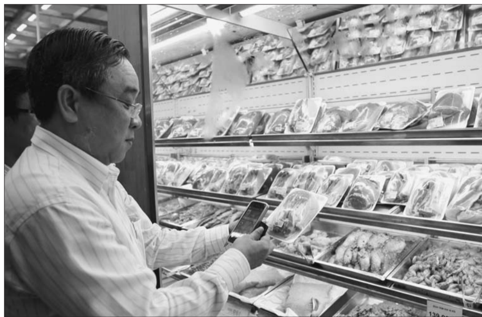
Người tiêu dùng truy xuất nguồn gốc thịt lợn bằng smartphone tại siêu thị

Truy xuất nguồn gốc là giải pháp thúc đẩy việc tiêu thụ nông sản bằng các nền tảng số, tạo thuận lợi cho người nông dân, DN, hợp tác xã, người tiêu dùng. Đồng thời, góp phần gia tăng giá trị nông sản của các địa phương, thiết thực tái cơ cấu ngành nông nghiệp trong giai đoạn mới theo hướng công khai, minh bạch, bình đẳng.