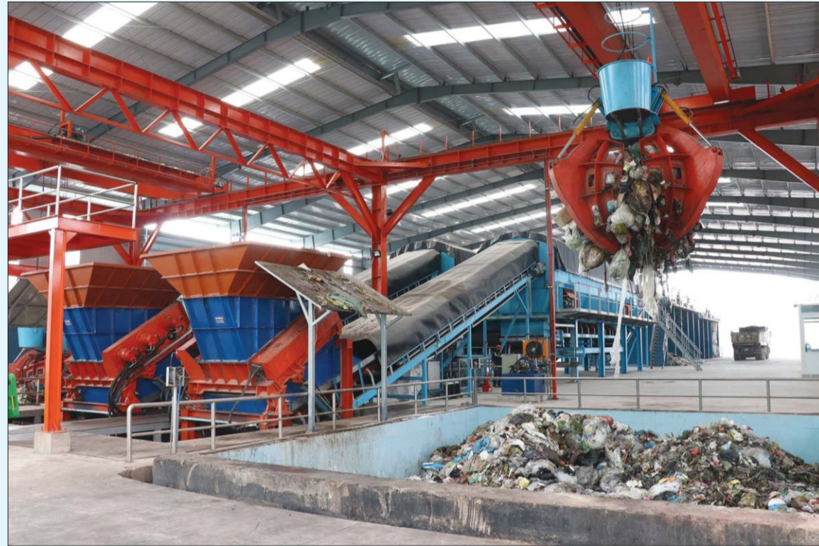
Nhà máy xử lý rác sinh hoạt thành phân hữu cơ (thuộc Công ty Biwase) tại thị xã Bến Cát, tỉnh Bình Dương

Thực tiễn cho thấy, rác thải hoàn toàn có thể trở thành nguồn lực đầu vào cho các hoạt động kinh tế. Tuy nhiên tại Việt Nam, rác thải hiện nay phần lớn được chôn lấp thô sơ, thiếu kỹ thuật. Giới chuyên gia khuyến nghị, Việt Nam cần chú trọng các giải pháp tái sử dụng, tái nạp để góp phần thúc đẩy kinh tế tuần hoàn (KTTH).