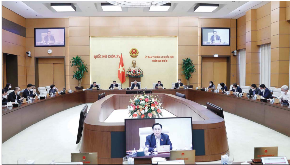
Quang cảnh Phiên họp

Với mục tiêu hướng đến phát triển thị trường bảo hiểm công khai, minh bạch, phù hợp thông lệ quốc tế, qua cho ý kiến về việc giải trình, tiếp thu, chỉnh lý Dự án Luật Kinh doanh bảo hiểm (sửa đổi), Ủy ban Thường vụ Quốc hội (UBTVQH) đã tập trung làm rõ những vấn đề còn có ý kiến khác nhau, đồng thời đề nghị Cơ quan chủ trì soạn thảo tiếp tục rà soát các quy định cụ thể nhằm bảo đảm lợi ích thỏa đáng của DN kinh doanh bảo hiểm và người mua bảo hiểm.