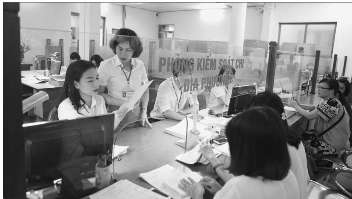
Bộ Tài chính đề nghị các Bộ, ngành, địa phương tiếp tục tiết kiệm triệt để các khoản chi thường xuyên năm 2022 Anh minh họa

Từ năm 2016 đến nay, mỗi năm NSNN đã giảm chi thường xuyên được hàng chục nghìn tỷ đồng. Mặc dù vậy, nhiều bất cập trong chi thường xuyên vẫn chưa được khắc phục triệt để. Bởi vậy, trong hướng dẫn thực hiện dự toán ngân sách năm 2022, Bộ Tài chính tiếp tục đề nghị các Bộ, ngành, địa phương giảm chi thường xuyên theo đúng quy định, ưu tiên nguồn lực cho phục hồi và phát triển kinh tế - xã hội.