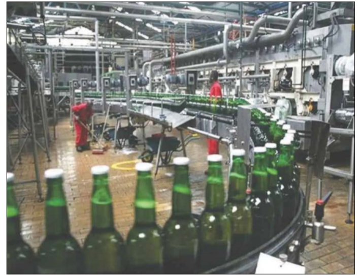
Các nhà máy sản xuất bia của Nigeria gặp nhiều khó khăn

Những năm gần đây, lĩnh vực sản xuất của Nigeria nói chung đang gặp phải nhiều khó khăn. Đây là hậu quả trực tiếp của việc giá dầu toàn cầu giảm do ảnh hưởng của đại dịch Covid-19 dẫn đến tình trạng đồng Naira mất giá, từ đó