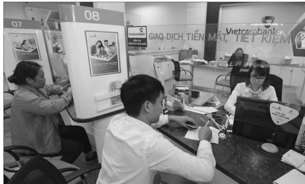
Chính sách tiền tệ trong nước đang phải chịu những tác động của tình hình kinh tế thế giới

Năm 2022, Ngân hàng Nhà nước Việt Nam (NHNN) tiếp tục điều hành chính sách tiền tệ theo hướng chủ động, linh hoạt để góp phần kiểm soát lạm phát, ổn định vĩ mô, hỗ trợ phục hồi và tăng trưởng kinh tế. Tuy vậy, việc thực hiện mục tiêu này đang đứng trước không ít thách thức.