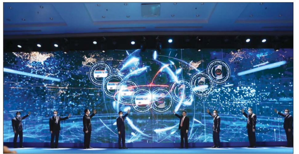
Các đại biểu thực hiện nghi thức ra mắt Cổng thông tin điện tử dành cho nhà cung cấp nước ngoài và triển khai ứng dụng eTax Mobile

Tại Lễ khai trương Cổng thông tin điện tử dành