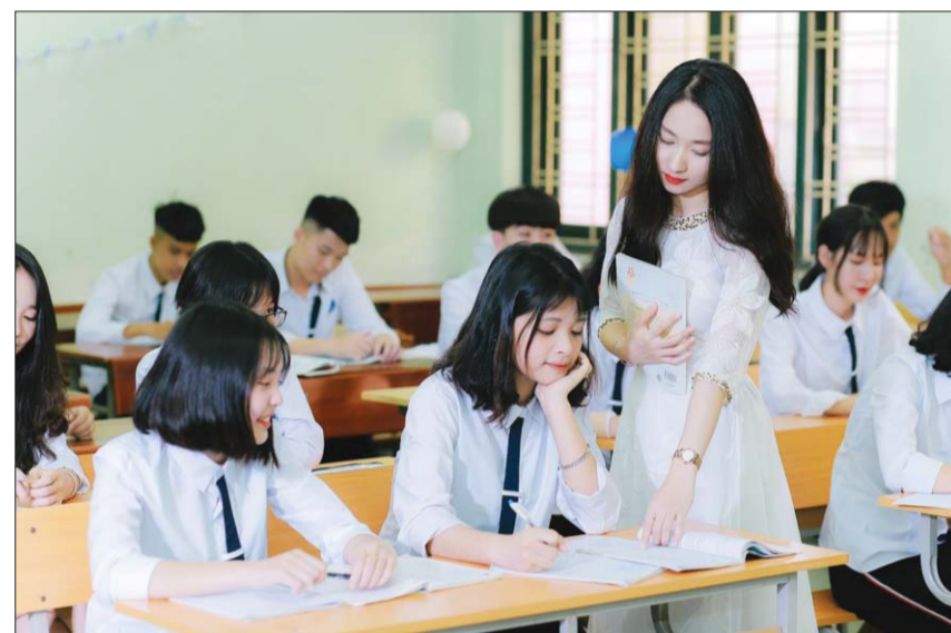
Việc thực hiện lộ trình tính đúng, tính đủ giá dịch vụ đào tạo cần được tính toán phù hợp và thận trọng, tránh ảnh hưởng lớn đến người học Ảnh tư liệu

Mặc dù mức tăng trong lộ trình là vậy nhưng nếu so với mức học phí năm học 2021-2022 thì học phí năm học 2022-2023 tăng vọt. Riêng khối ngành y dược tăng 71,33%, nghĩa là đang ở mức trần 1,43 triệu đồng/tháng tăng lên thành 2,45 triệu đồng/tháng. Các khối ngành còn lại hầu hết đều tăng mức hơn 20% đến gần 30% so với năm học 2021-2022 và ít nhiều sẽ gây sốc cho người học.