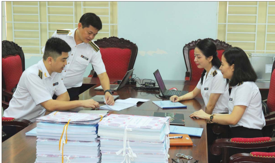
Chất lượng công tác lập, thẩm định và phát hành BCKT của KTNN trong thời gian qua đã từng bước được chuẩn hóa, cải thiện rõ rệt

Báo cáo kiểm toán (BCKT) là sản phẩm cuối cùng của quá trình kiểm toán, phản ánh kết quả, chất lượng của hoạt động kiểm toán, do đó, việc nâng cao chất lượng BCKT là yêu cầu thường xuyên, liên tục của KTNN. Để nâng cao chất lượng BCKT, ngoài việc chú trọng nâng cao chất lượng từ khâu lập kế hoạch kiểm toán, tổ chức thực hiện kiểm toán, cần đặc biệt chú trọng đến công tác lập, thẩm định và phát hành BCKT.